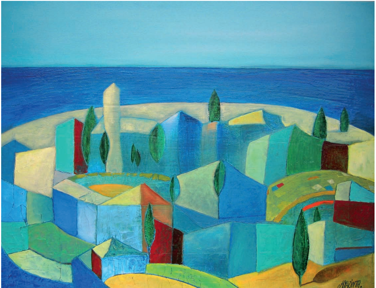
Insel, 2004, Mischtechnik auf Leinwand, 80x60 cm