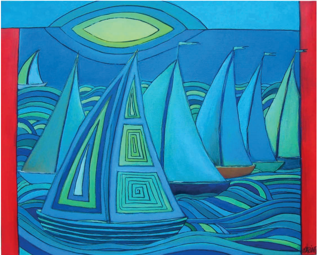
Regatta, 2005, Öl auf Leinwand, 100x80 cm