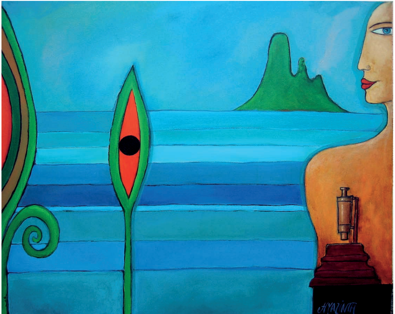
Pflanzengeographie, 2004, Öl auf Leinwand, 100x80 cm