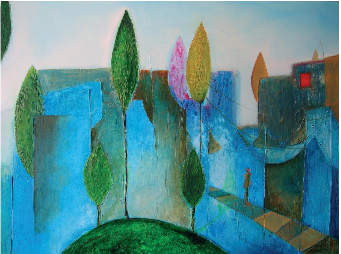
Stadtansicht, 2004, Mischtechnik auf Leinwand, 80x60 cm